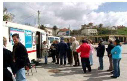
Medição de níveis de glicémia e tensão arterial

As acções a desenvolver neste âmbito visam promover a saúde e a informação médica gratuita junto dos utentes do Paredão. A sua concretização conta com o apoio da Cruz Vermelha Portuguesa.