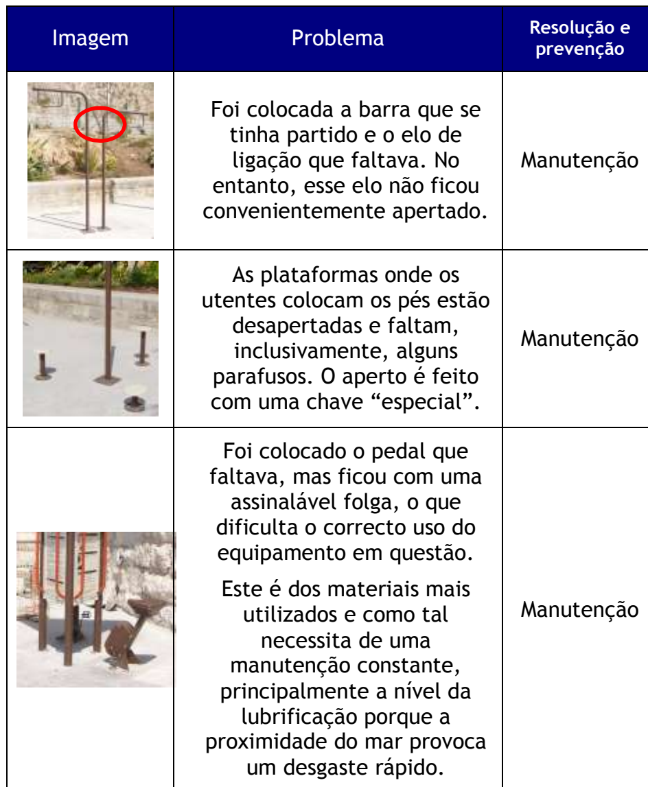
Quadro II - Monitorização do Equipamento de Educação Física do Paredão

Neste particular, e em comparação com anteriores relatórios, existem estações do LifeTrail que foram recuperadas, no entanto, ainda se encontram algumas falhas que podiam ter sido colmatadas na última intervenção.